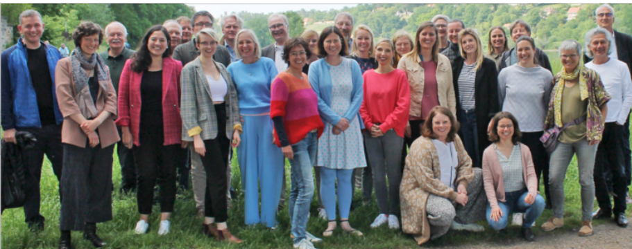
Die Leitungen unserer regionalen Ausbildungszentren

Selbsterfahrung, Lehrgangsleitung, Materialien und Skripte, Verwaltungskosten, Ausstellung einer Teilnahmebescheinigung bzw. eines Zertifikates enthalten. Hierin nicht enthalten sind Kosten für die Einzel-Supervision (ca. 5.500 Euro für die erforderlichen 50 Stunden) , der Aufwand für die eventuelle Unterkunft am Ausbildungsort und ggf. der Aufenthalt in Tagungshäusern.