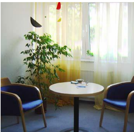
Therapieraum am Ausbildungszentrum Münster