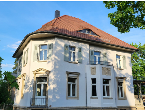
Unser Ausbildungszentrum in Dresden

Gegenstand der schriftlichen Prüfung sind die „Grundkenntnisse in den wissenschaftlich anerkannten psychotherapeutischen Verfahren“ (§ 16 Abs.1 PsychTh-APrV), die im Rahmen einer beaufsichtigten, zweistündigen Klausur geprüft werden. Den staatlichen Gegenstandskatalog hierzu finden Sie unter www.impp.de .