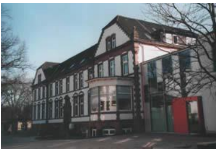
Unser PP-Ausbildungszentrum in Hamburg